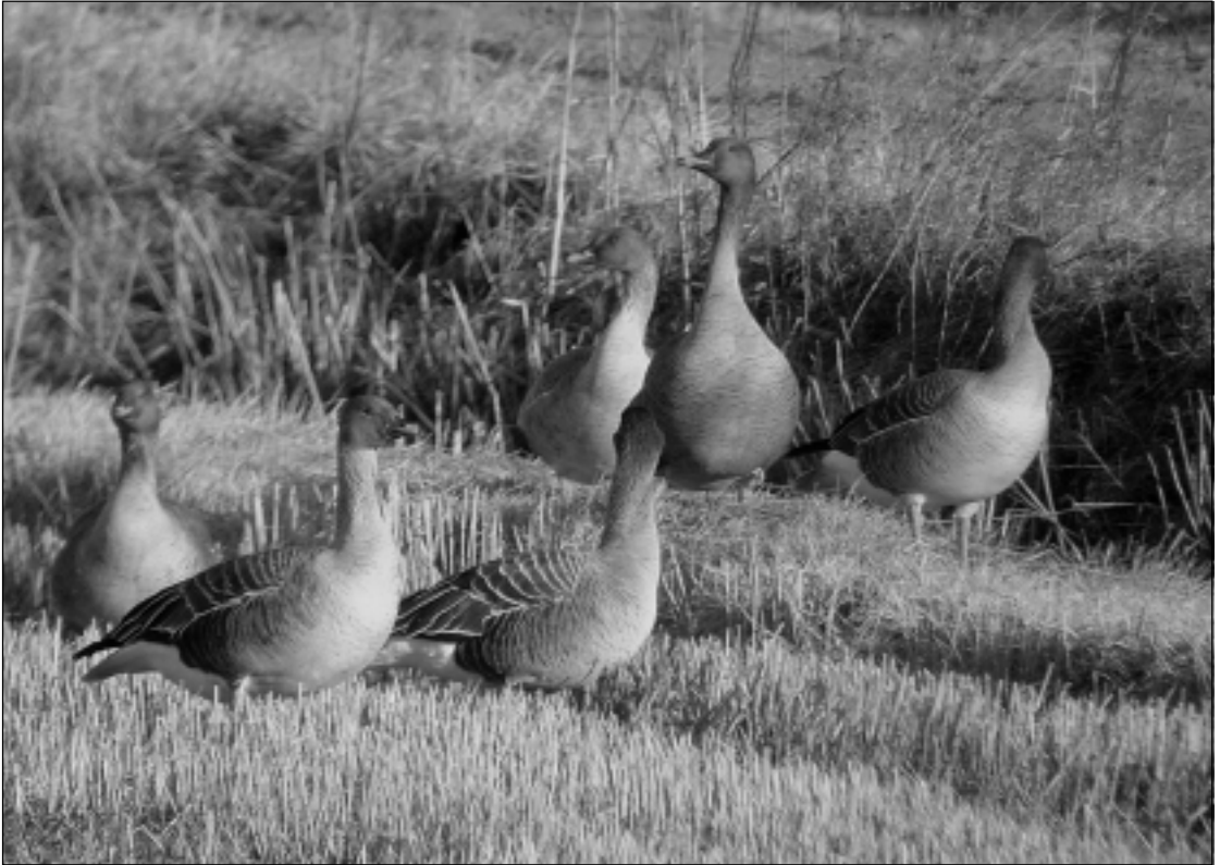
Metsähanhi on keväisten pellojen runsain laji.