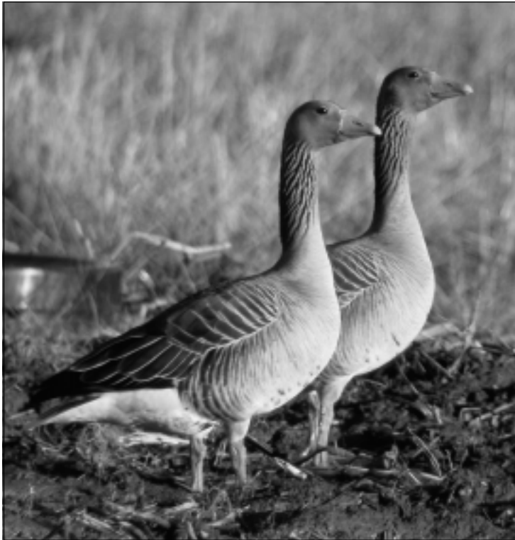
Merihanhet saapuvat hanhista ensimmäisinä.