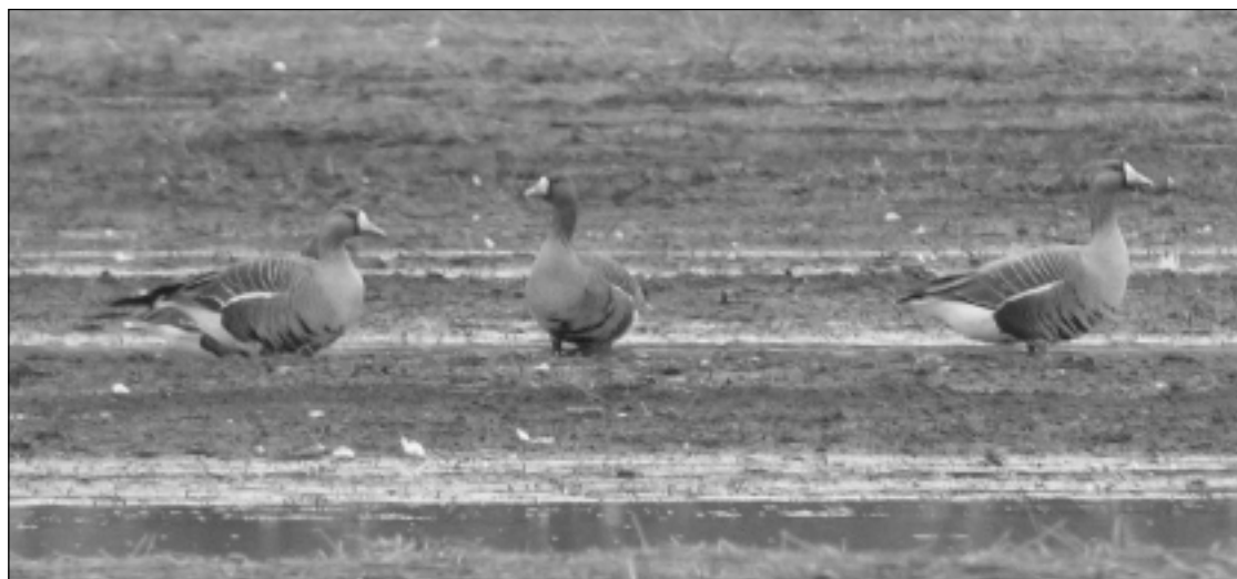
Tundrihanhi on harvinainen vieras keväisillä hanhipelloilla.